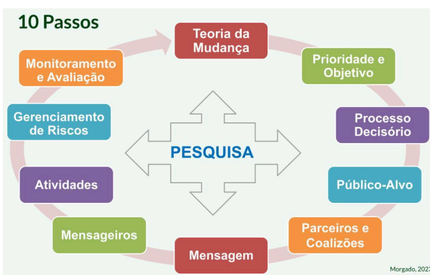
Figura 5. Os 10 Passos da Estratégia de Advocacy.

Posteriormente relembrou os 10 passos do guia, enaltecendo que a presente oficina trataria apenas do primeiro passo, a Teoria da Mudança .