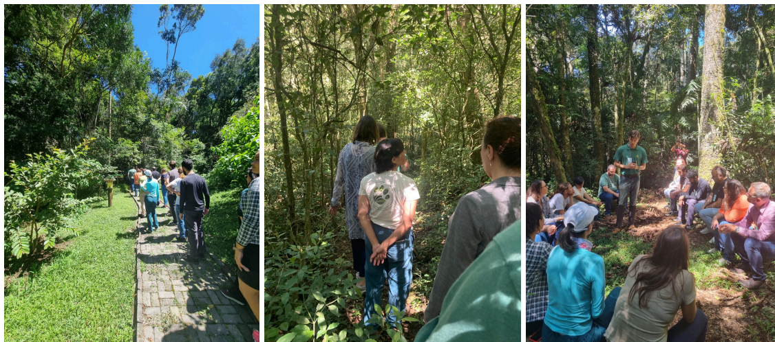
Figura 8. Trilha do Tatu na RPPNM Airumã.