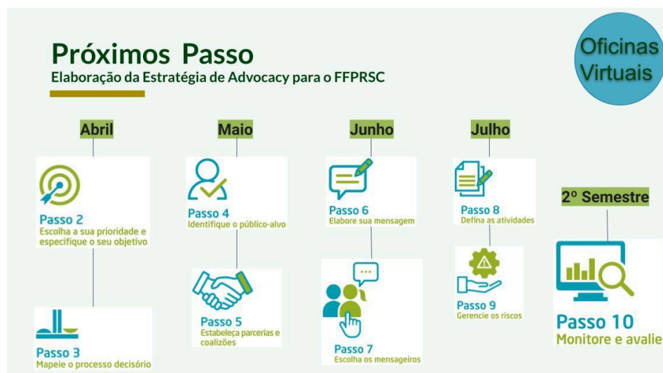
Figura 9. Próximos passos para a elaboração da Estratégia de Advocacy do FFPRSC para PSA

As Oficinas de Elaboração da Estratégia de Advocacy para o FF PR e SC para PSA serão realizadas virtualmente, com duas reuniões por mês até julho/2024, a serem definidas por enquete no grupo do whatsapp.