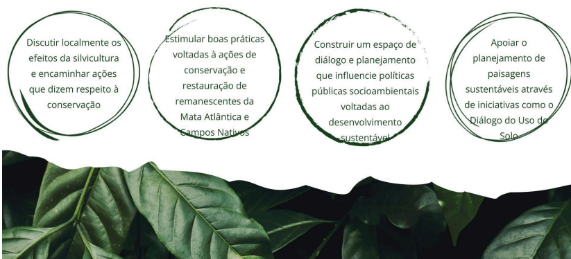
Figura 4. Objetivos Específicos do FF PR e SC.