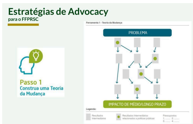
Figura 6. Ferramenta Teoria da Mudança.

Para a elaboração da Teoria da Mudança, os participantes foram divididos em grupos, a fim de facilitar o diálogo e a construção coletiva do problema, dos resultados intermediários almejados e do impacto pretendido a médio e longo prazo. Após a discussão necessária para cada etapa, os resultados foram apresentados à plenária e unificados para validação da proposta.