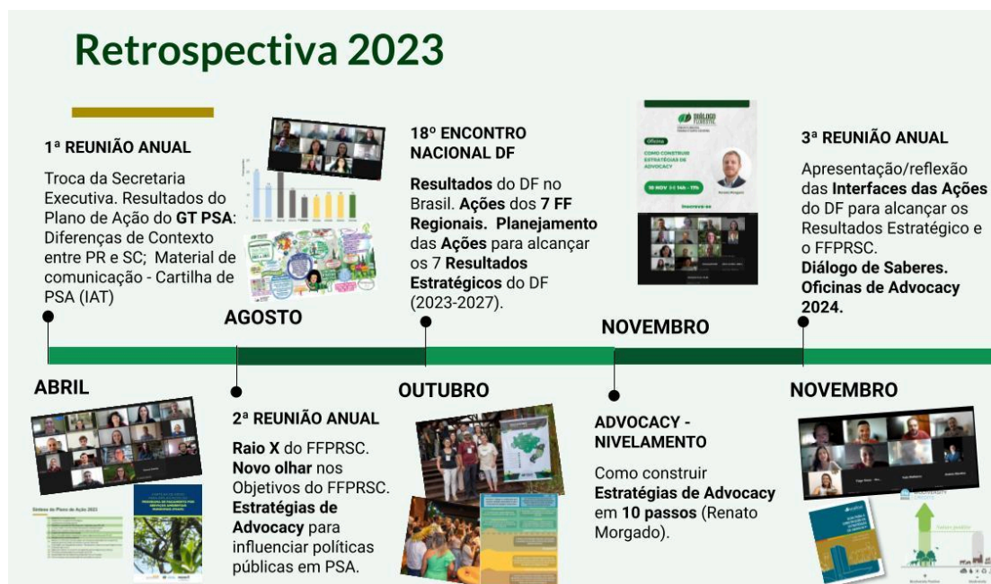
Figura 2. Retrospectiva 2023 do FF PR e SC.

Renata apresentou o Portfólio do FF PR e SC e a linha do tempo das reuniões e ações do Fórum Florestal PR e SC em 2023. Explicou que as três reuniões anuais foram virtuais devido ao mau tempo na região sul, com muitas chuvas e temporais, que inviabilizaram a reunião presencial de novembro.