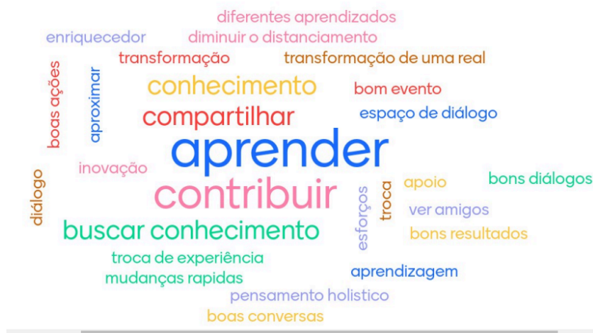
Figura 1. Expectativas para a 1ª Reunião do FFPRSC de 2024.