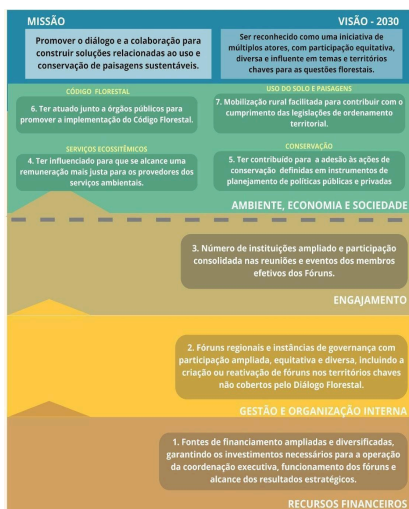
Figura 3. Mapa Estratégico do Diálogo Florestal.